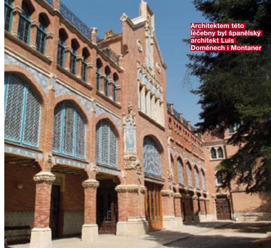
Architektem této léčebny byl španělský architekt Luis Doménech i Montaner