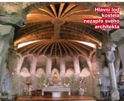
Hlavní loď kostela nezapře svého architekta