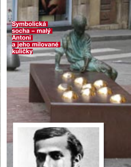
Symbolická socha – malý Antoni a jeho milované kuličky