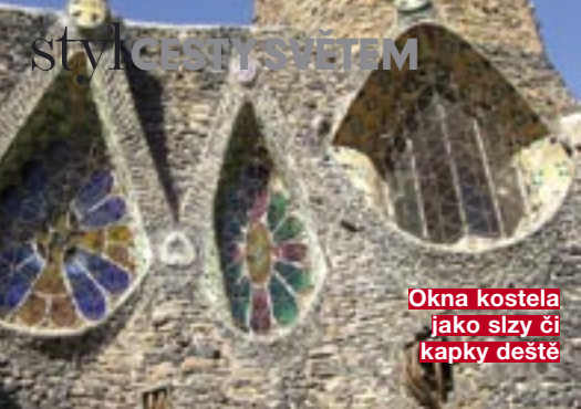
Okna kostela jako slzy či kapky deště